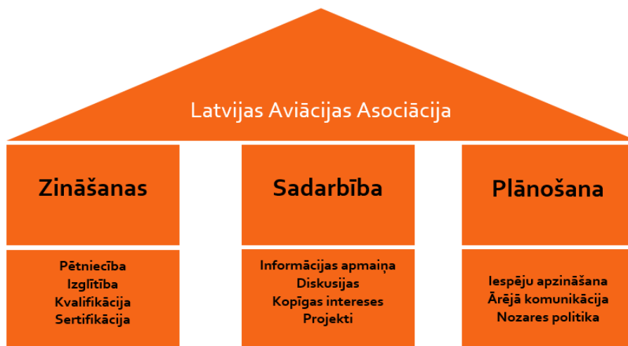
Attēls Nr.1. Latvijas Aviācijas Asociācijas vērtības